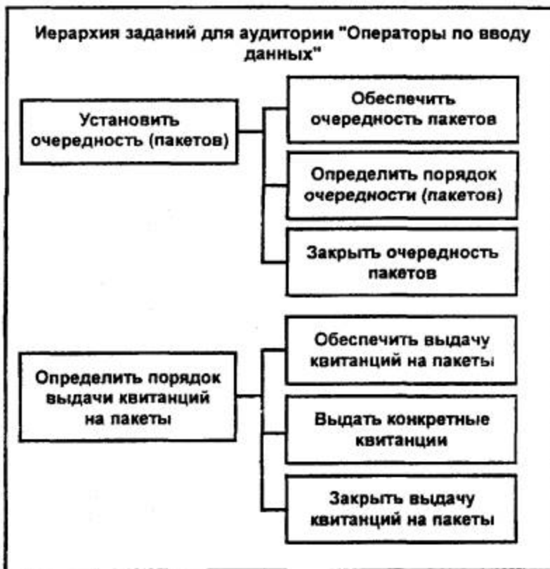
Рисунок D.2 - Иерархия заданий

На следующем этапе для определенной аудитории в рамках выданных ей заданий определяют перечень ее потребностей в информации (information needs) . На основе данного перечня определяют содержание конкретного документа, как показано на рисунке 3 .