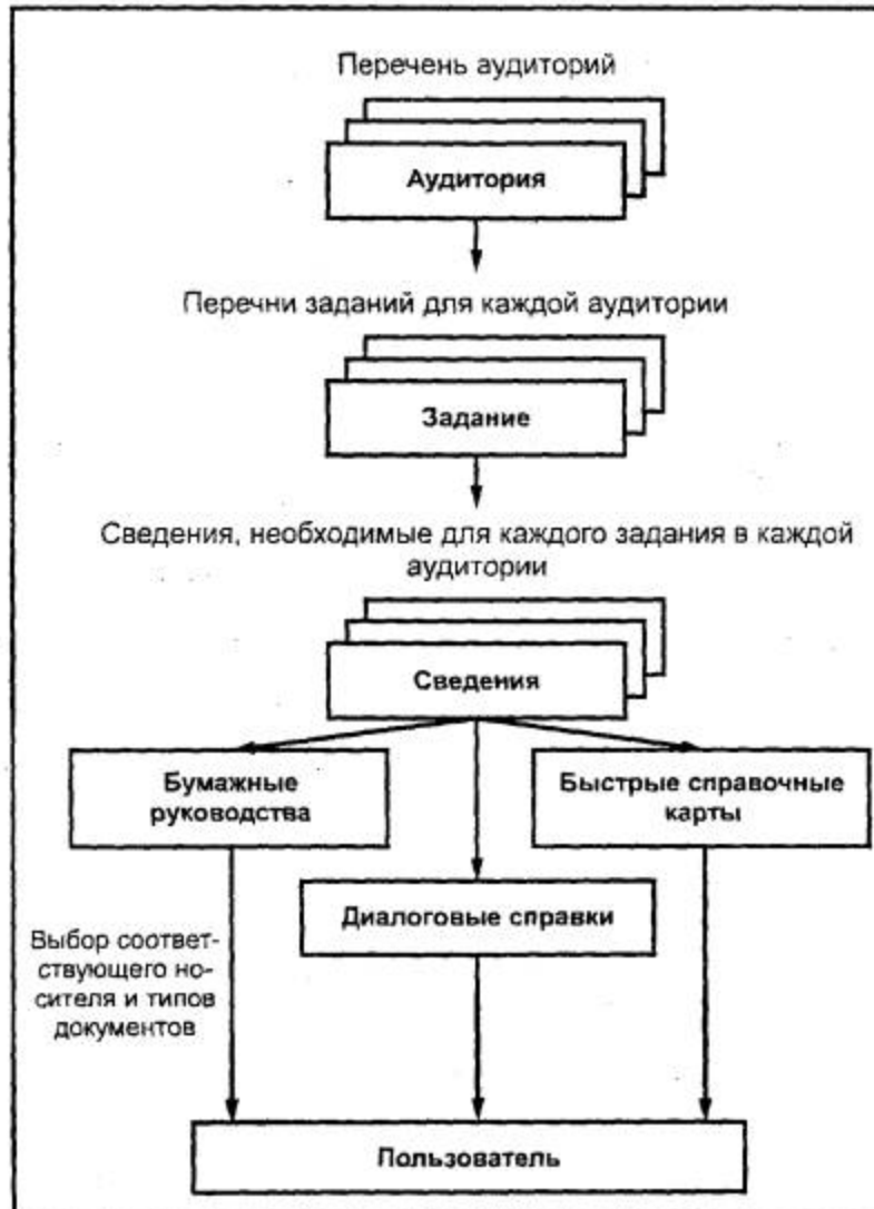
Рисунок D.4 - Общая структура процесса проектирования документирования

Более подробное описание процесса проектирования документации приведено в BS 7649-93 [2].