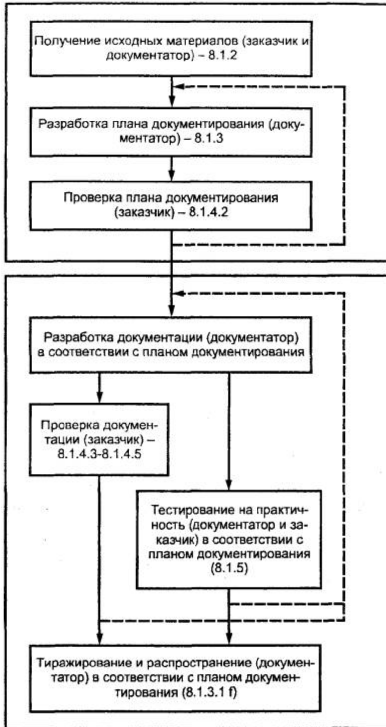
Рисунок 1 - Обзор процесса документирования