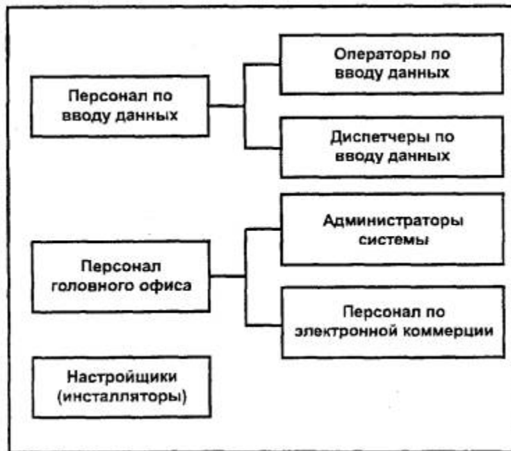
Рисунок D.1 - Иерархия аудиторий

В ряде случаев иерархию аудиторий целесообразно представлять в виде отдельных групп, как показано на рисунке D.1 .